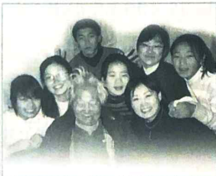
표지설명 : 대청소를 하고 할머니와 함께 찍은 사진

여 / 명 / 가 / 정 / 봉 / 사 / 원 / 파 / 견 / 센 / 터