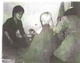
▲ 짹 짹! 이야, 할머니 10년은 젊어 보인다.