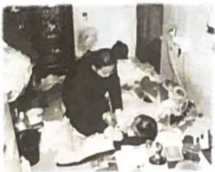
▲ 어이 시원하다