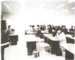
▲ 아하! 봉사는 이런거구나 교육도 매우 중요합니다.