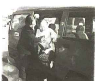
▲ 할머니! 다 왔어요. 조심히 내리세요(병원후송서비스)