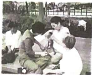
▲ 어이 처자!! 나도 할업 좀 재주~