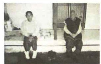
▲ 가져다준 도시락은 잘 먹었어요 고마워요!!