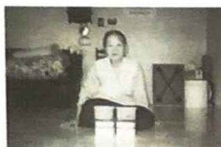
▲ 입맛이 없어서 밥을 푹 못 먹었는데 반찬이 입에 맞아서 잘 먹었네.