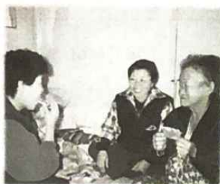
▲ 고마워!! 맛있는 간식이네