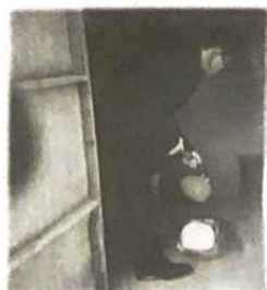
▲ 앵~ 옥! 파리, 바퀴벌레 한방에!!