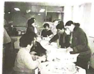
▲ 정성들여 준비합니다.