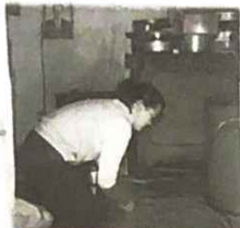
▲ 쓱쓱 쓱쓱! 닦아도 닦아도 끝이 안보이네