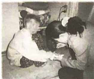
▲ 살살해! 할머니 걱정마세요 제가 간호사예요.

이렇듯 아름답고 보람찬 하루하루를 살아가려고 노력하는 많은 사람들을 만나게 해 주시고 또 그 사랑으로 나를 감화시키고 나라는 이기주의를 넘어 '우리'라는 사랑속으로 인도하신 하나님께 감사사를 드린다.