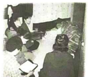
▲ 경화, 하나님주신선물! 천사같은 찬양소리에 감동감동!!