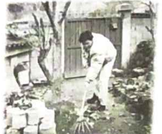
▲ 휘~익! 짹! 나뭇잎이 다 내게로 와라